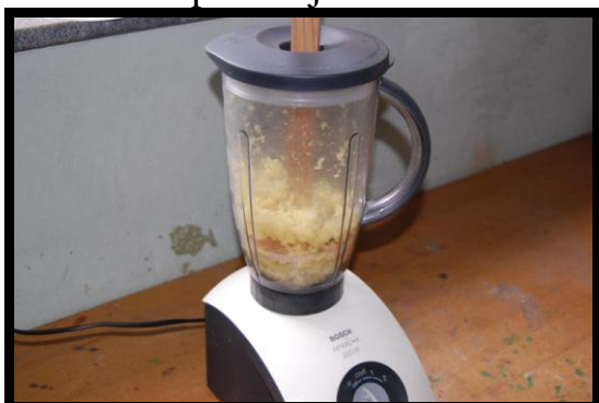
7. ...in vklopil sekljalnik.