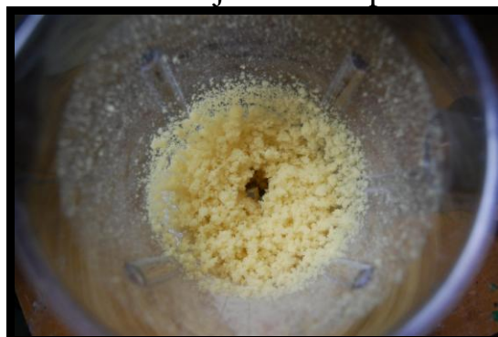
8. Ko sem sekljalnik izklopil...