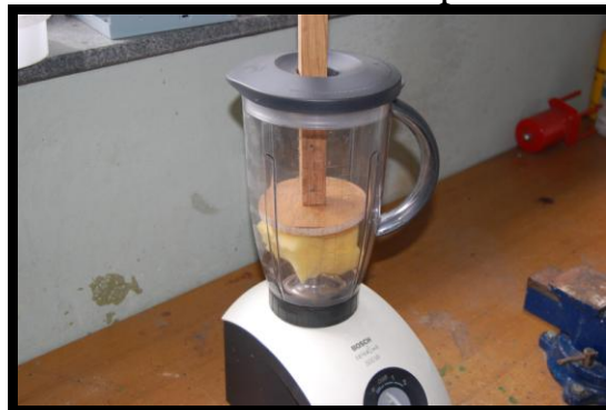
6. ...vstavil stiskalnico in pokrov...