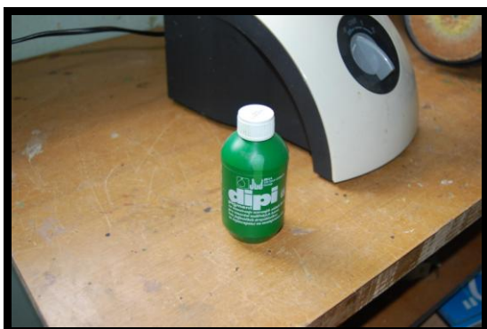
9. ...sem vzela zelen pigment...